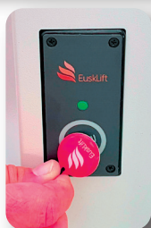
Botonera de piso sistema NFC